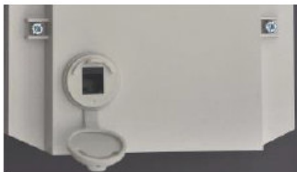
Abbildung 1: Der Anschlussstecker der Verbraucherinformationsschnittstelle ist ein RJ12-Stecker, bei dem nur die Stifte 3 und 4 aktiv sind. Die Schnittstellenabdeckung kann nach dem Schliessen plombiert werden.